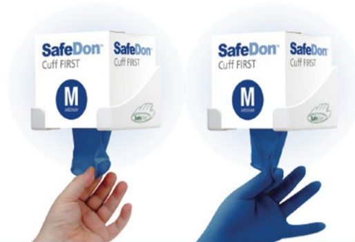
Figura 1: Fotografia representativa do conceito de dispensa das luvas